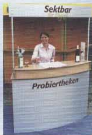
Quicky-Rundbogen Probiertheke (Art. Nr. 0.530)