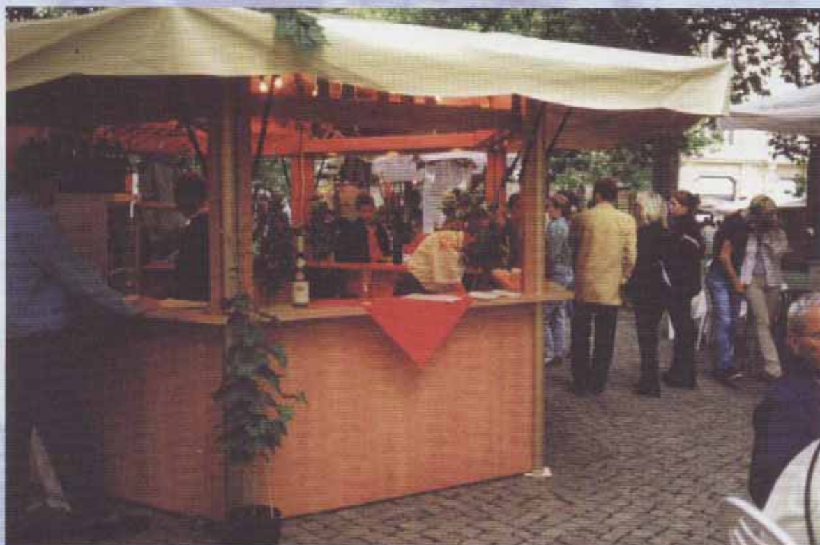
Ecostar "Rivaner" mit großer Tür und Lageranbau (Art. Nr. 3.900)

HEITEC Heiser GmbH Pavillon Messebau International