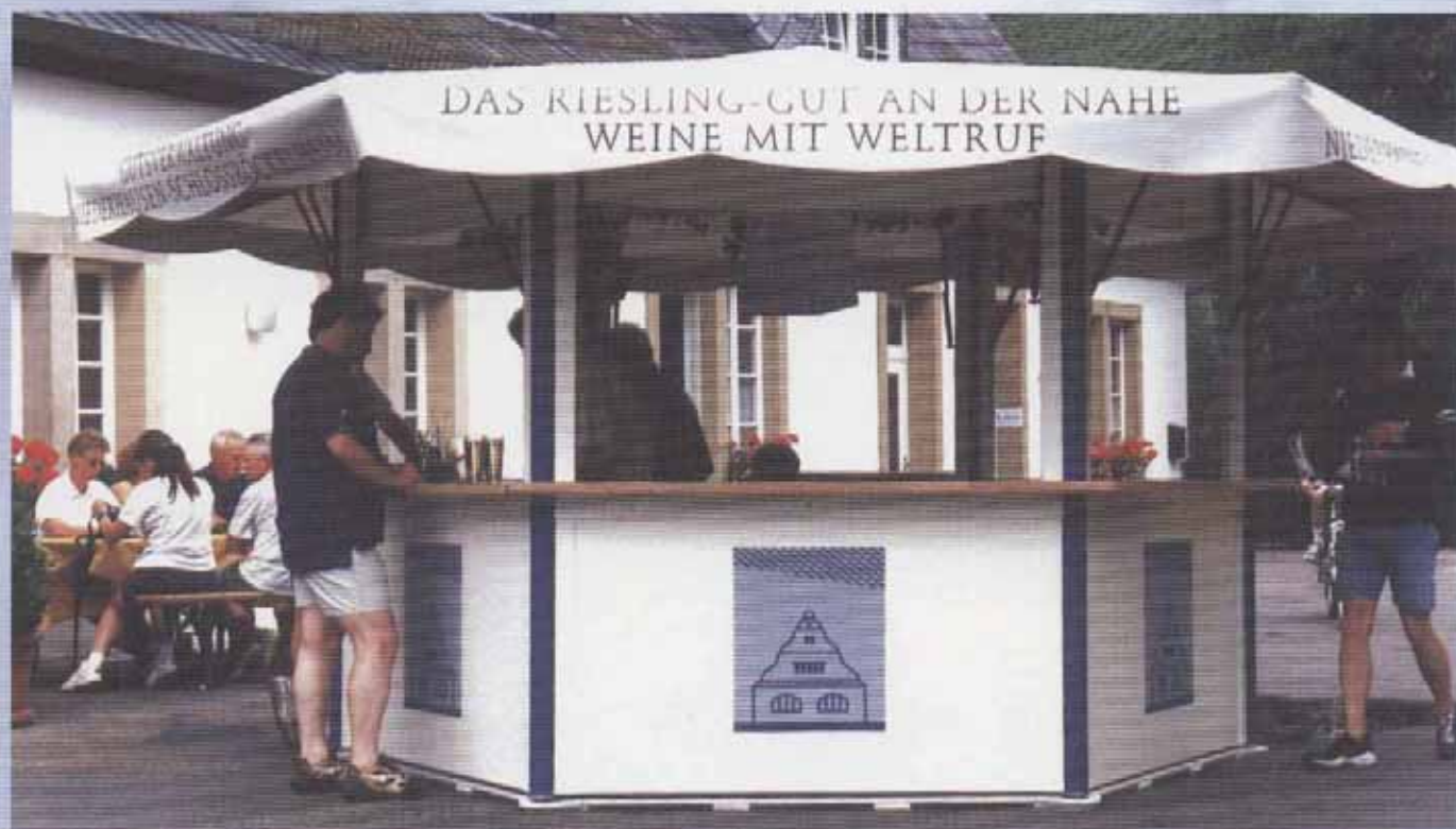
Ecostar "Riesling" mit kleiner Tür und umlaufenden Thekenborden (Art.Nr.3.100)

Der universelle 6-Eck Großpavillon gestaltet nach Ihren Wünschen