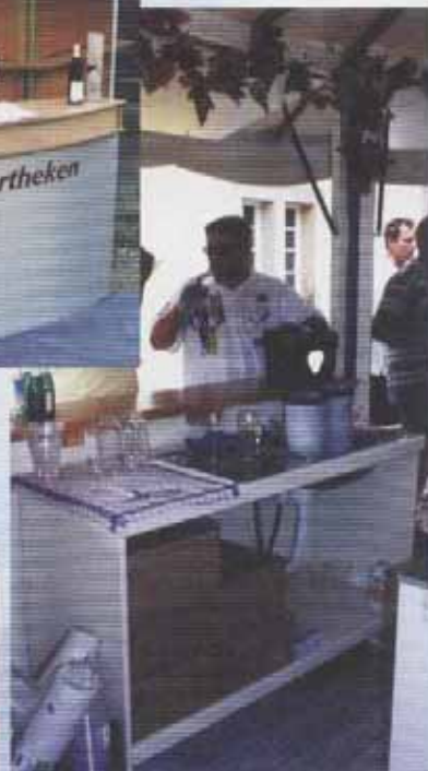
Zerlegbare Spüle mit Gläser- Spülboy (Art. Nr. 1.250)