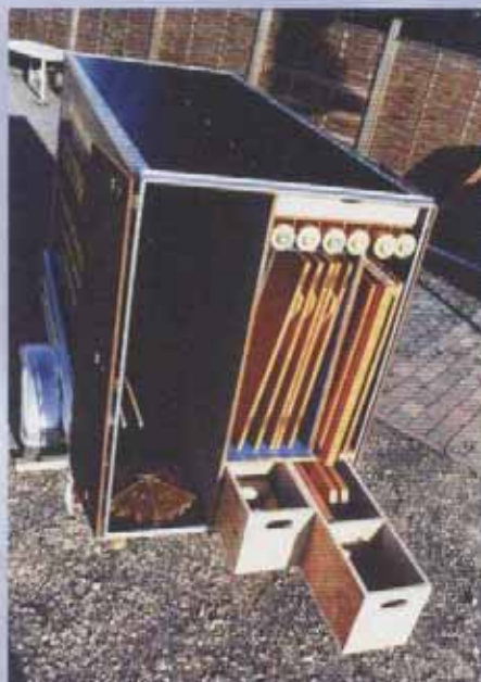
Express-Packcontainer auf Anhänger (Art. Nr. 3.600)