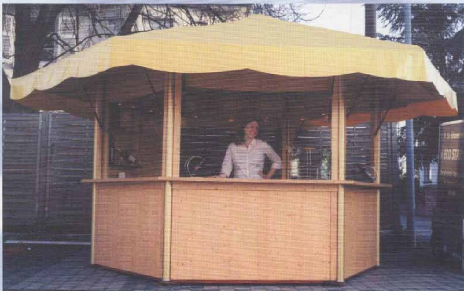
Ecostar "Chardonay" mit großer Tür und Präsentationsregal (Art. Nr. 3.000)